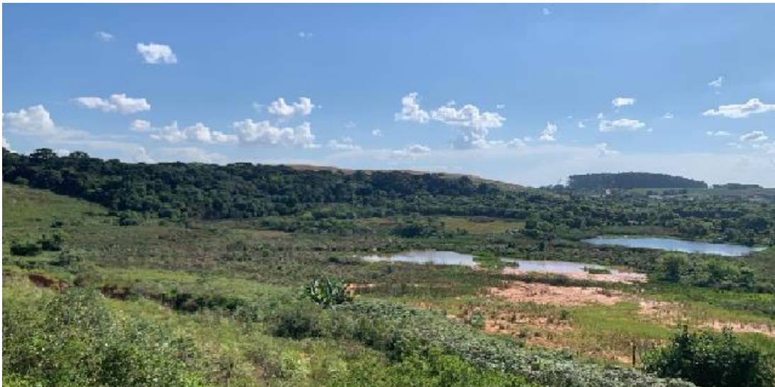
Figura 1: Área de depósito de água provenientes do Aterro Sanitário de Fazenda Rio Grande

Sendo assim, com base na legislação e nos resultados do IAT, o aterro sanitário de Fazenda Rio Grande atenderia todos os critérios necessários para uma instalação de baixo impacto ambiental e social, porém na prática, o que se vê nos últimos anos é que o manejo do aterro tem gerado impactos negativos (Figura 1).