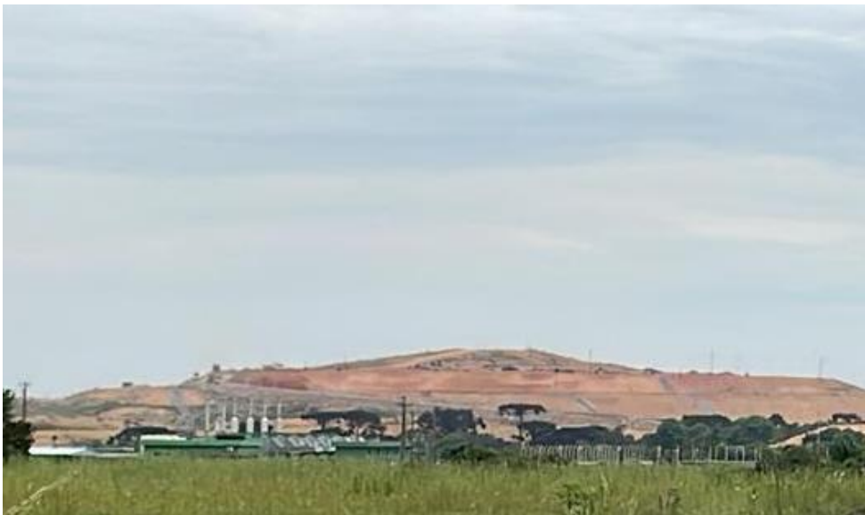
Figura 4: Vista frontal do aterro sanitário de Fazenda Rio Grande

Todos têm direito ao meio ambiente ecologicamente equilibrado, bem de uso comum do povo e essencial à sadia qualidade de vida, impondo-se ao Poder Público e à coletividade o dever de defendê-lo e preservá-lo para as presentes e futuras gerações (Brasil, 1988).