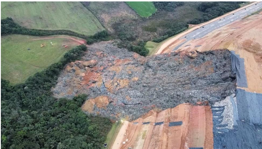
Figura 3: Aterro sanitário de Fazenda Rio Grande após o deslizamento