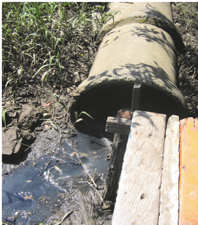
Foto1: Manilha despejando esgoto no manguezal de Gargaú

O manguezal da região e seus canais são de significativa importância para o desenvolvimento das atividades de pesca e a captura de caranguejos. Entretanto, estão ameaçados por fazendeiros e pela própria população local (SANTOS; QUEIROZ; TERRA, 2014; ROCHA, 2015; SOFFIATI, 2007). Segundo Abreu et al. (2007), os principais problemas encontrados são o lançamento de lixo e esgotos domésticos (Foto 1).