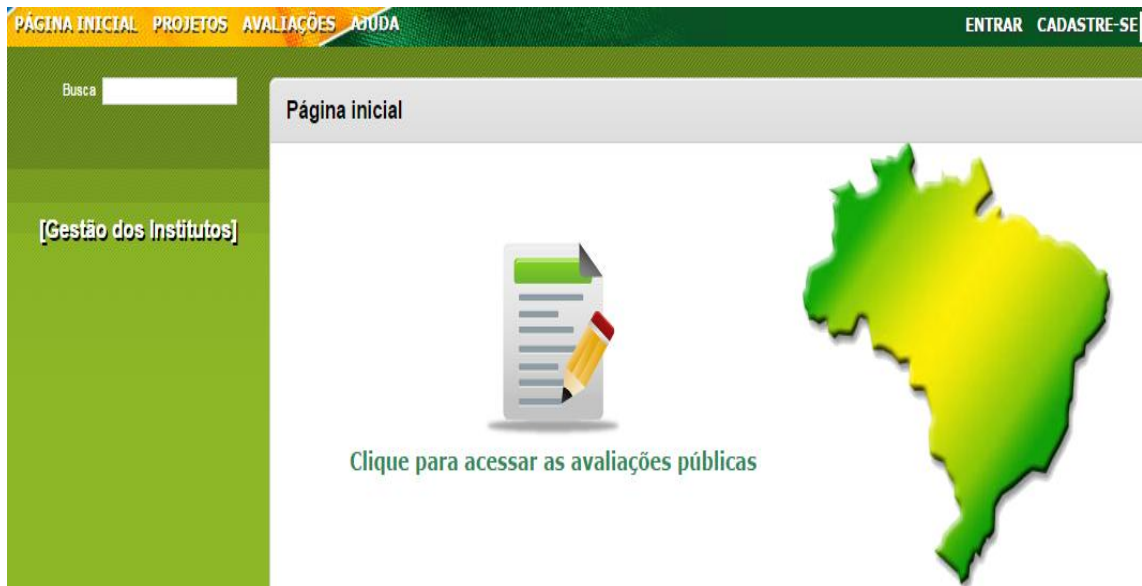
Figura 2. Tela Inicial do SGI