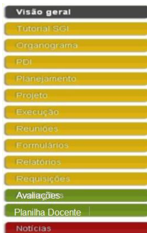
Figura 1. Menu do Sistema de Gestão dos Institutos

O sistema pode ser acessado pelo endereço gestao.iff.edu.br .