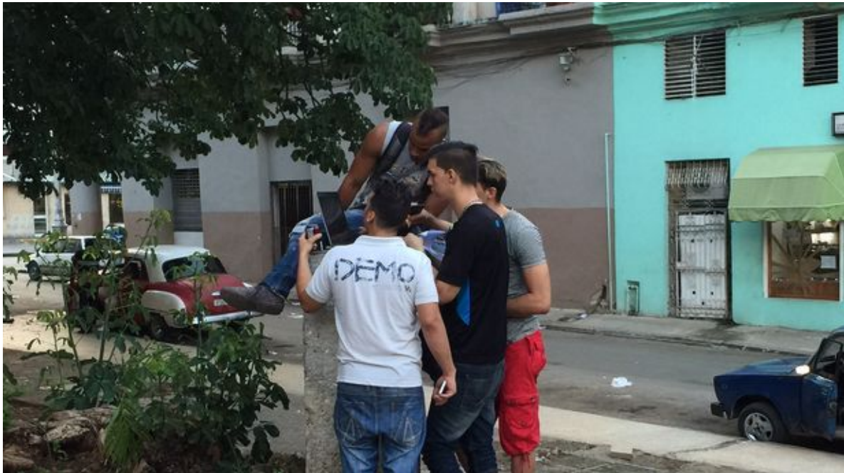
Imagem 5 - Acesso à rede Wi-Fi no centro de Havana