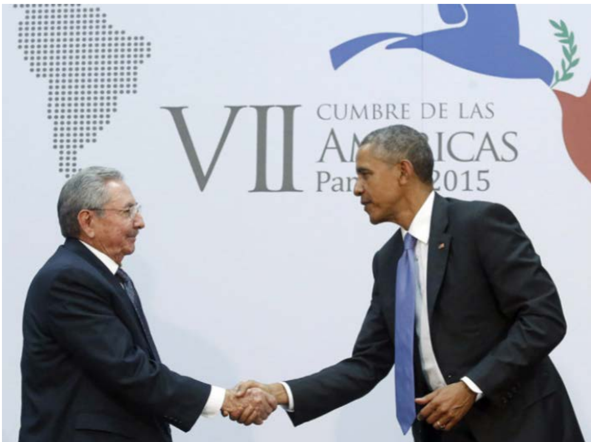
Imagem 3 – Encontro de Castro e Obama no Panamá

No campo diplomático, em março, foi a vez da União Europeia (UE) iniciar as tratativas para normalizar as relações entre o bloco europeu e a ilha comunista. No dia 11 de abril, durante a VII Cúpula das Américas, no Centro de Convenções Atlapa, no Panamá, Barack Obama e Raúl Castro se encontraram pessoalmente pela primeira vez desde o telefonema histórico. Três dias depois, Obama anunciou a retirada de Cuba da lista de países que financiam o terrorismo.