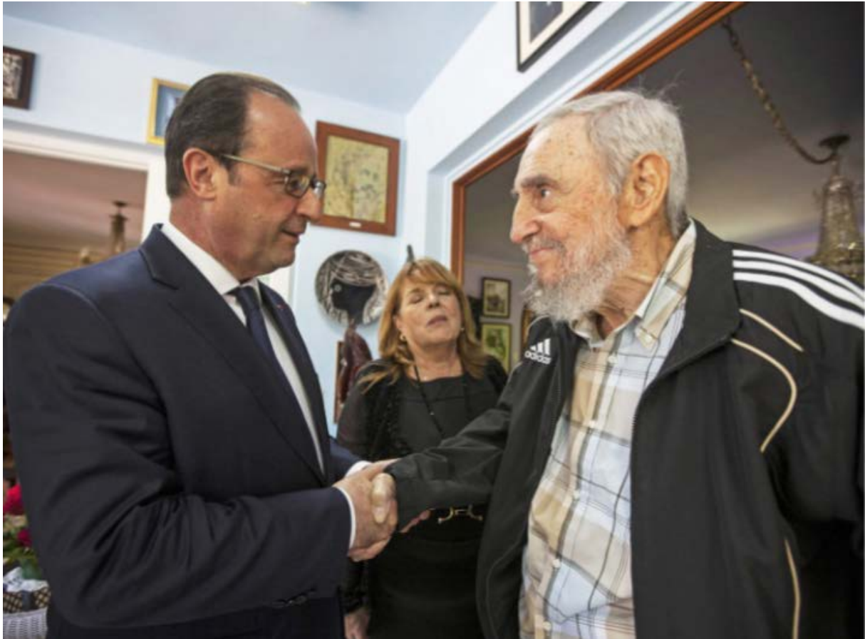
Imagem 4 – François Hollande se encontra com Fidel Castro em Havana

que nossas empresas possam administrar mais livremente seus recursos. Não é para nosso próprio interesse, mas para que haja mais investimentos em Cuba”, disse Hollande ao fim um fórum econômico em Havana. Durante sua visita ele fez questão de se encontrar com Fidel Castro.