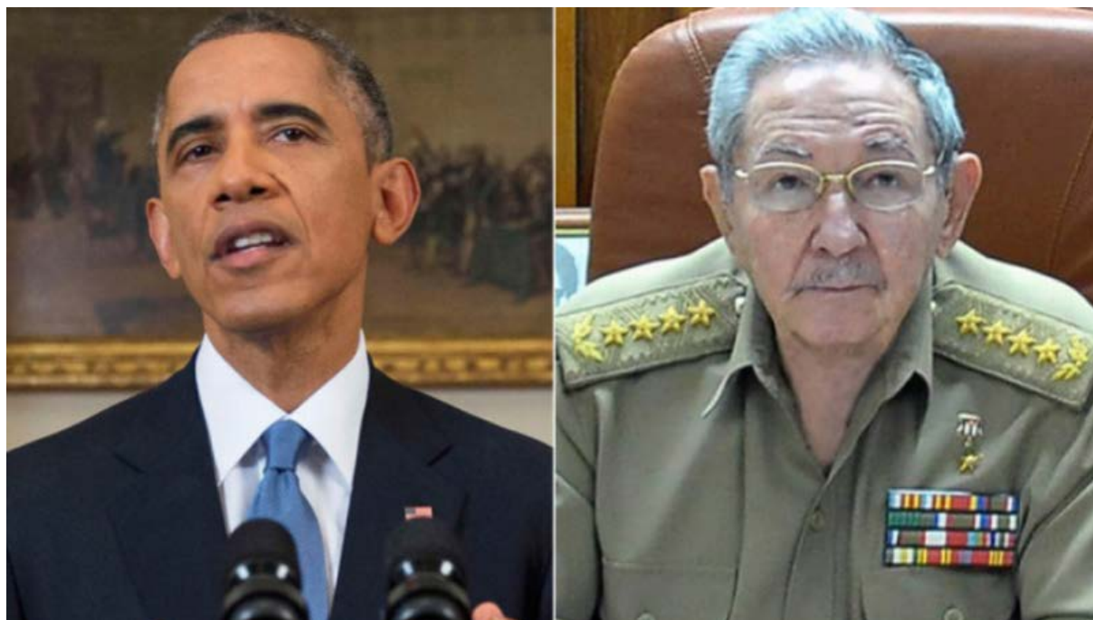
Imagem 1 – Barack Obama e Raúl Castro durante pronunciamento simultâneo

Em 17 de Dezembro de 2014, depois de longa conversa telefônica, os respectivos chefes de estado divulgaram em Televisão aberta, simultaneamente, o acordo que permitirá a reabertura das embaixadas e o alívio de sanções, podendo também pôr fim ao embargo econômico que aflige os cubanos há décadas, caso haja apoio do Congresso Americano. A contrapartida do governo cubano será garantir maior liberdade de expressão e permitir o desenvolvimento das telecomunicações em Cuba.