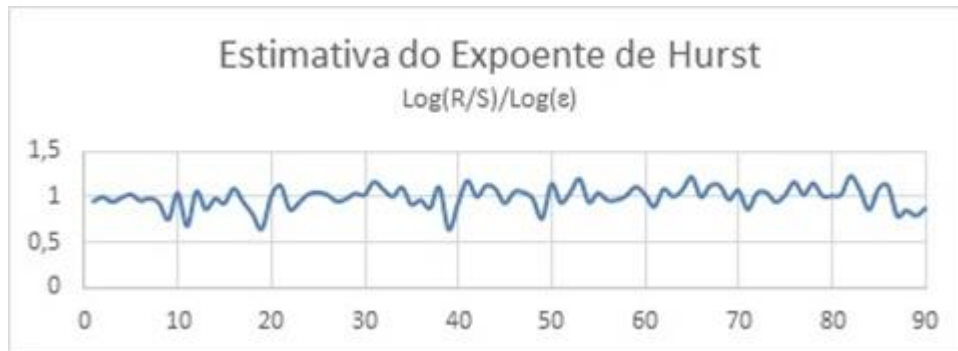
Figura 2 - Variabilidade do Expoente de Hurst

Após as análises dos dados verificou-se que o expoente de Hurst se encontra dentro das indicações de persistência, como é possível verificar na Figura 2.