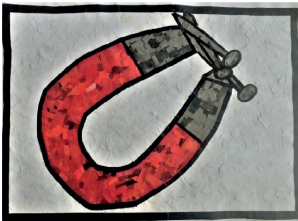
Figura 2 - Acervo do projeto "Eu vos declaro Engenharia e Arte"