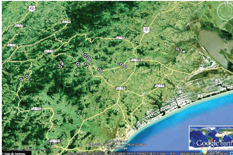
Figura 16: Mapa com pontos de coleta na Bacia Hidrográfica do Rio Macabu.