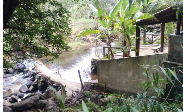
Figura 11: Barragem irregular para criação de piscinas particulares no curso do Rio Santa Catarina.

Além disso, existem no local, placas e cercas elétricas e de arame farpado que impedem o acesso ao rio, excluindo e condicionando esta área ao desfrute de apenas uma parcela da população, o que se configura claramente em um caso de injustiça e racismo ambiental, visto que as propriedades de padrão elevado no alto da bacia indicam o predomínio de moradores com poder aquisitivo considerável, mas a maior parte dos habitantes se concentra a jusante destes pontos, em áreas onde o rio já se encontra extremamente poluído e degradado. No entanto, a Lei N° 9.433/97, que instituiu a Política Nacional de Recursos Hídricos – PNRH, em seu Artigo 1º, afirma que: “a água é um bem de domínio público”, justificando a afirmação de que a norma ambiental aponta para um direito difuso, pertencente a todos, onde o direito ao meio ambiente ecologicamente equilibrado caminha para uma perspectiva integral, pressupondo a noção de justiça ambiental e a percepção das bacias hidrográficas como espaços cada vez mais dilatados e de maior complexidade que necessitam de uma proteção ambiental eficaz e equânime que amplie a sustentabilidade desses sistemas (ROCHA & SANTANA FILHO, 2008).