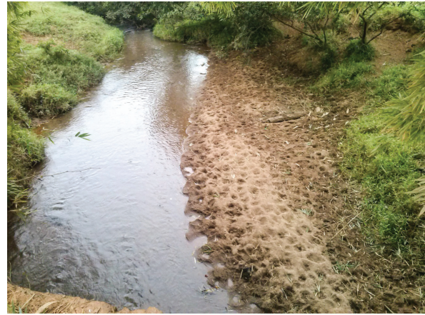
Figura 5: Depósitos de Sedimentos nas margens de rio com formação de bancos de areia e assoreamento do Rio Santa Catarina.

Portanto, os maiores índices pluviométricos nessa região da bacia indicam a necessidade de preservação das áreas de florestas nativas com vistas à manutenção da qualidade do solo e da água. Considerando esses fatores em conjunto, podemos observar que quanto mais afetadas forem as áreas de nascentes de rio, nas serras e montanhas da região, maior sua capacidade de degradação.