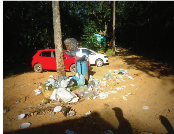
Figura 9: Entrada de visitantes da Cachoeira da Amorosa no Núcleo Municipal de Ecoturismo Monica da Rocha da Prefeitura de Conceição de Macabu-RJ que atualmente se encontra abandonado.

Esse quadro de degradação promovido pela ocupação irregular das margens de rio e uso indiscriminado dos recursos naturais, aliado a falta de fiscalização por parte dos órgãos ambientais responsáveis, pode ser comparado com a situação em que hoje se encontra o Rio Santa Catarina, afluente do Macabu. Durante a saída de campo para fins de avaliação ambiental, notou-se a existência de propriedades particulares em áreas de preservação permanente. Segundo a Lei Federal N° 12.651 de 25 de Maio de 2012, que instituiu o novo Código Florestal, para rios com até 10 metros de largura deve ser preservada a faixa marginal de 30 metros, no entanto, não é o que observamos nesta bacia. Também foi possível identificar uma série de pequenas barragens construídas para criação de piscinas e poços particulares em uma clara atitude de apropriação e privatização da água.