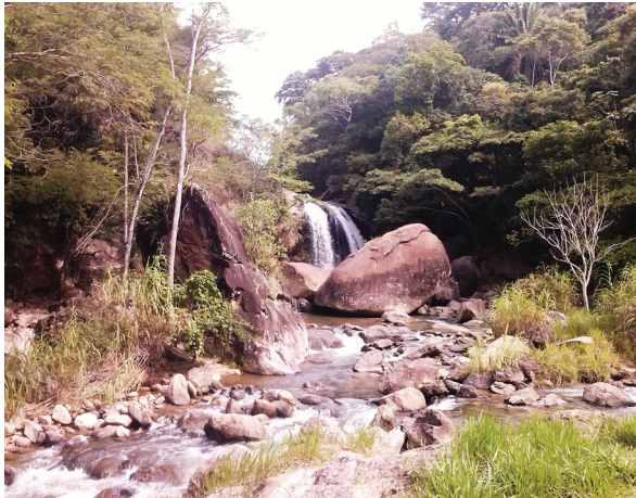
Figura 8: Cachoeira da Amorosa (maior atrativo turístico da região).