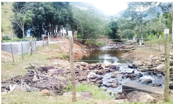
Figura 12 e 13: Cercas e placas que restringem o acesso ao rio Santa Catarina.

Além disso, existem no local, placas e cercas elétricas e de arame farpado que impedem o acesso ao rio, excluindo e condicionando esta área ao desfrute de apenas uma parcela da população, o que se configura claramente em um caso de injustiça e racismo ambiental, visto que as propriedades de padrão elevado no alto da bacia indicam o predomínio de moradores com poder aquisitivo considerável, mas a maior parte dos habitantes se concentra a jusante destes pontos, em áreas onde o rio já se encontra extremamente poluído e degradado. No entanto, a Lei N° 9.433/97, que instituiu a Política Nacional de Recursos Hídricos – PNRH, em seu Artigo 1º, afirma que: “a água é um bem de domínio público”, justificando a afirmação de que a norma ambiental aponta para um direito difuso, pertencente a todos, onde o direito ao meio ambiente ecologicamente equilibrado caminha para uma perspectiva integral, pressupondo a noção de justiça ambiental e a percepção das bacias hidrográficas como espaços cada vez mais dilatados e de maior complexidade que necessitam de uma proteção ambiental eficaz e equânime que amplie a sustentabilidade desses sistemas (ROCHA & SANTANA FILHO, 2008).