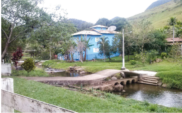
Figura 10: Residências irregulares de alto padrão em áreas de preservação permanente no Rio Santa Catarina.