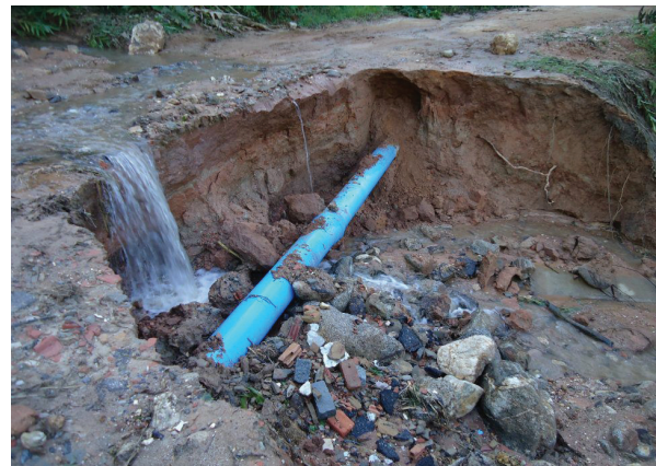
Figura 3: Processo Erosivo no Alto Curso do Rio Macabu