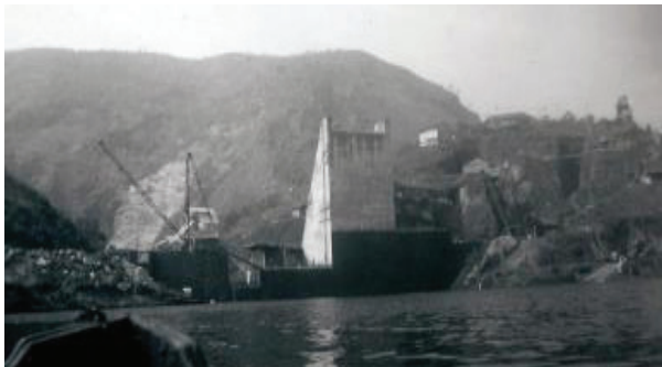
Figuras 14 e 15: Construção da Barragem do Macabu e Imagem da Situação Atual.

Em 1931, foram iniciados estudos preliminares para a instalação de uma usina hidrelétrica no Rio Macabu com finalidade de fornecer energia para a cidade de Macaé e região. O local escolhido abrangeu dois trechos de duas bacias hidrográficas, o primeiro no Rio Macabu, próximo às localidades de Tapera e Sodrelândia, no Município de Trajano de Moraes a uma altitude de 650 metros e o segundo trecho em Macaé, numa altitude de 300 metros. Entre os vales das duas bacias hidrográficas, estende-se um túnel de 4.907 metros de comprimento que leva água transposta de uma bacia para outra, para mover as turbinas das Usinas de Macabu e também de Glicério. Assim foi preciso construir a Barragem do Macabu, próximo à localidade de Sodrelândia, entre 1939 e 1952. Sua estrutura tem aproximadamente 100 metros de curvatura e 40 metros de altura proporcionando a formação de um enorme espelho d'água artificial, possui uma tomada d'água superior e uma casa de máquinas no centro do reservatório que capta a água para ser transposta (GOMES, 1998).