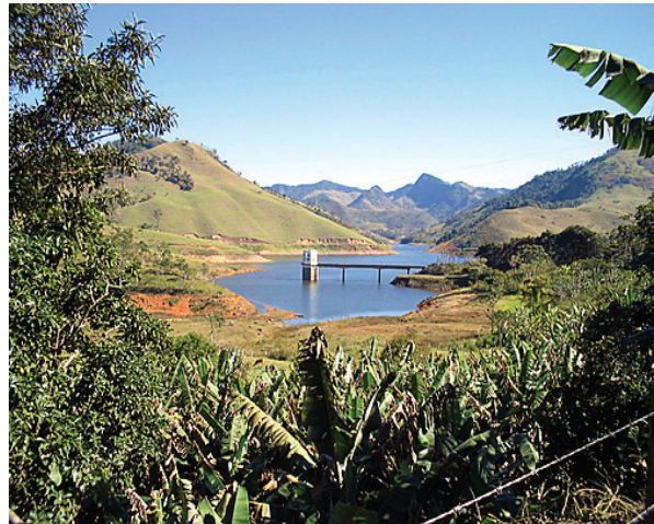
Figura 7: Plantações de Banana e olericultura na região montanhosa da Bacia do Macabu.