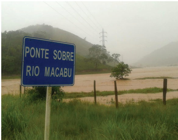
Figura 14: Rio Macabu em período de cheias (aumento do escoamento superficial e enchentes nas áreas de planícies).