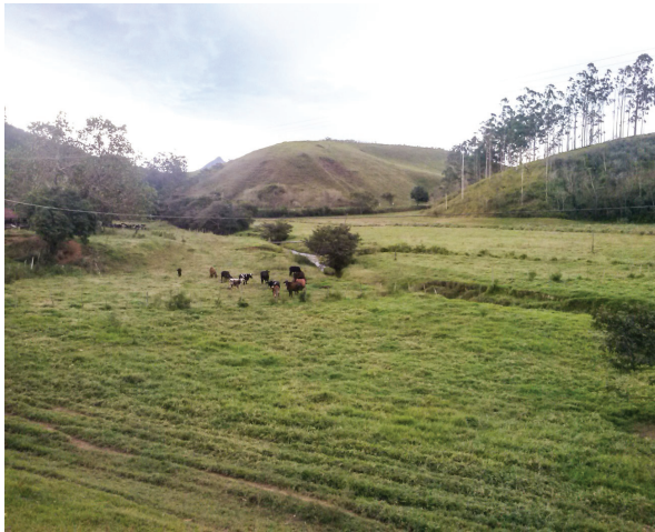
Figura 6: Campos de Pastagens para Criação de Gado na Zona Colinosa da Bacia do Macabu;

Segundo Pruski (2006), a falta de cobertura florestal propicia o aquecimento da superfície do solo, acelerando a decomposição da matéria orgânica, reduzindo a atividade biológica e intensificando a perda de solo por erosão. Além disso, o padrão desordenado de ocupação rural no Brasil indica uma contribuição para a perda da biodiversidade e de qualidade de vida, com graves conseqüências ambientais e humanas (SOARES et. al. 2002, ACSELRAD, 2004).