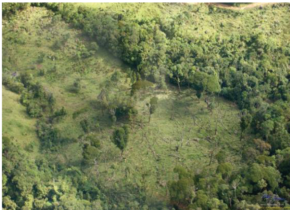
Figura 2: Desmatamento no Alto Curso do Rio Macabu