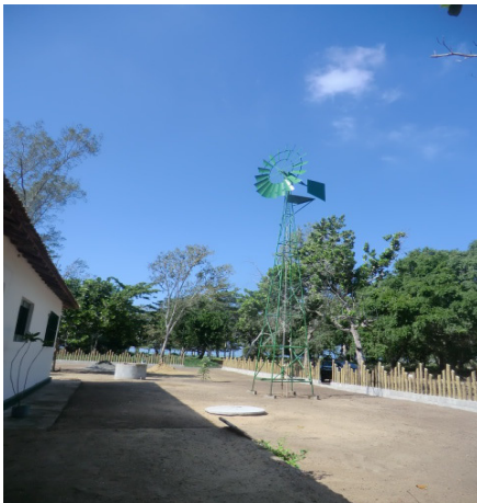
Figura 5. Vista da lateral da casa sede