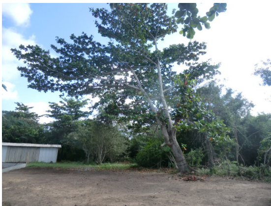
Figura 1. Parte da casa sede

Pode se observar a área estudada por meio das imagens abaixo onde se destaca parte da casa sede administrativa e a vegetação do seu entorno.