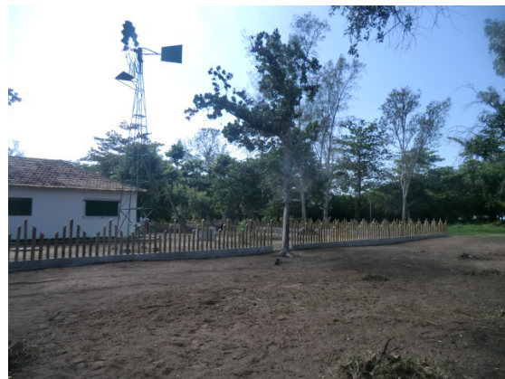
Figura 2. Vegetação no entorno da casa sede