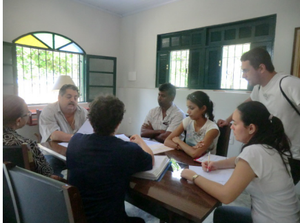
Figura 3. Reunião com os administradores