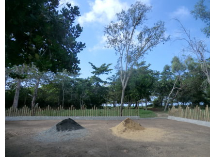
Figura 4. Sinais de obras. (modificações)