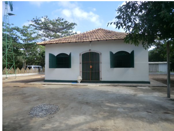
Figura 6. Vista frontal da casa sede