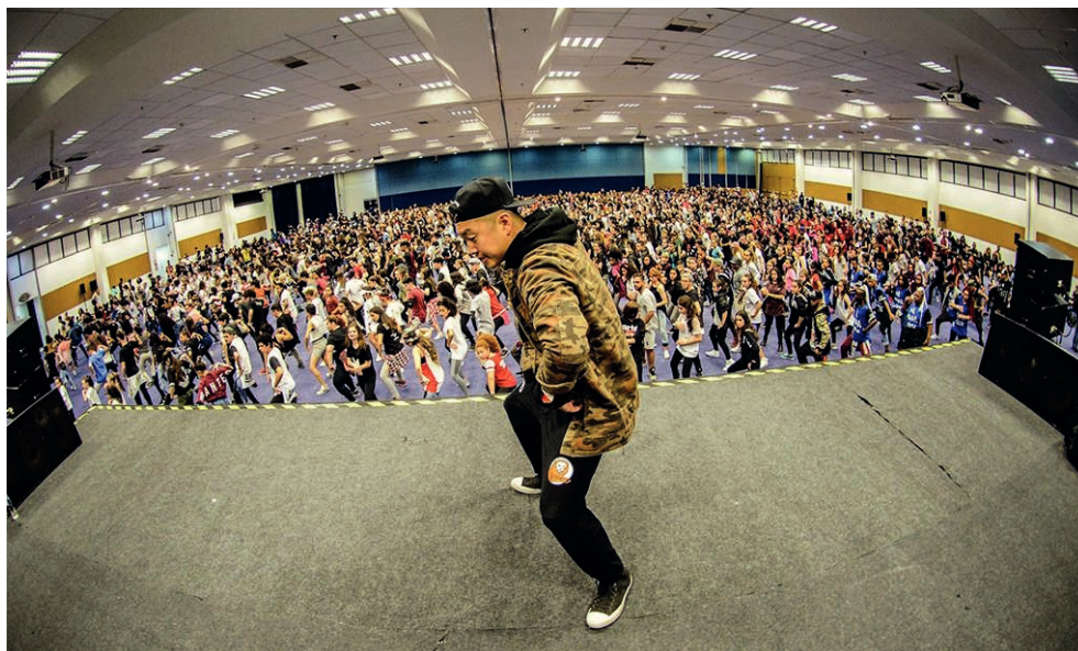
Figura 1. Festival Internacional de Hip-hop (I)