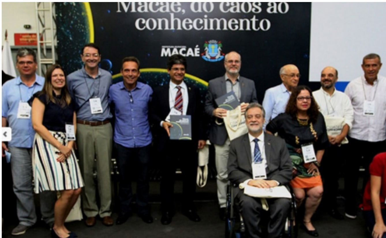
Figura 2. membros do observatório, reitores das instituições de ensino, membros do poder público e representantes da sociedade civil no lançamento do livro “Macaé, do caos ao conhecimento” - Feira Brasil Offshore, 2019