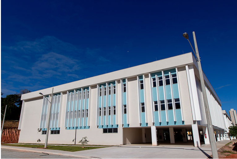
Figura 4. Bloco D da Cidade Universitária de Macaé (ICM/UFF)