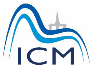
Figura 3. Logomarca ICM

Durante a Agenda Acadêmica no ano de 2018, após ampla participação democrática, vários logos foram criados pela própria comunidade acadêmica; houve votação, e a escolha aberta definiu o logotipo do ICM (Figura 3).