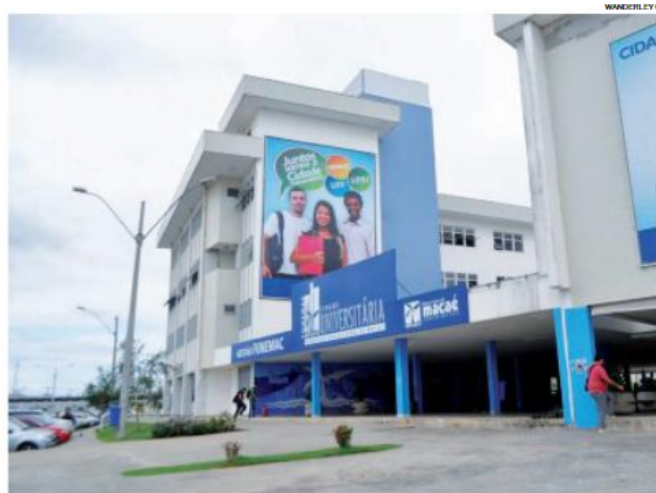
A instituição fica situada na Cidade Universitária, mesmo local onde está o campus da UFRJ