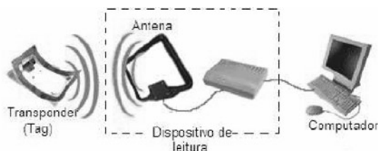
Figura 1: Esquema Básico do RFID

O princípio de funcionamento do RFID é bem simples. A figura abaixo ilustra como é feita essa operação. O leitor emite um sinal de radiofrequência através da antena, que pode estar acoplado ao leitor ou ligado por um fio ao mesmo, com o intuito de localizar as tags que captam e emite o sinal constantemente quando está na área coberta pelo o leitor. Desta forma, a tag responde ao leitor também por radiofrequência, enviando todas as informações do produto contida na etiqueta. O leitor envia, em tempo real, essas informações recebidas para o sistema computacional que tem instalado um software específico para reconhecer e identificar essas informações, obtendo assim, o privilégio de conseguir fazer o gerenciamento necessário para o bom funcionamento deste sistema.